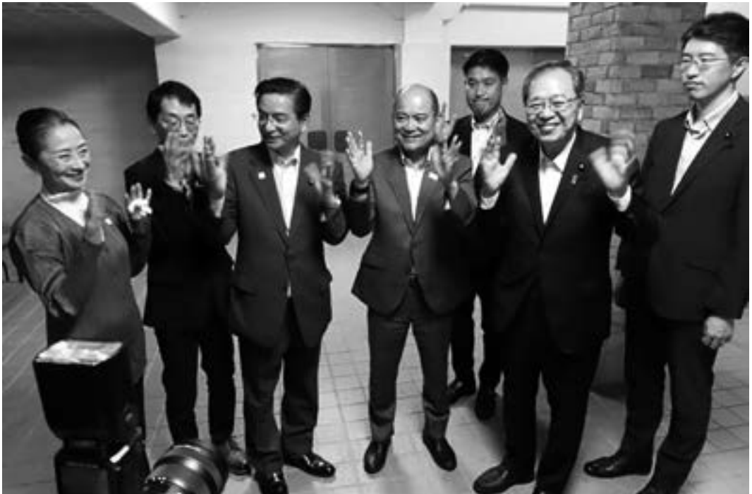
手話施策推進法成立後 全日本ろうあ連盟の皆様と公明党議員団（2025年6月）