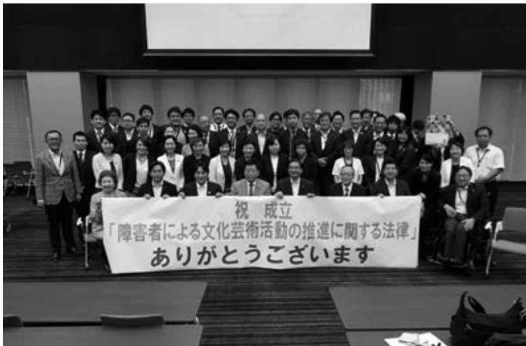
障害者文化芸術推進法成立後 超党派議連と障害者団体の皆さんと (2018年6月)