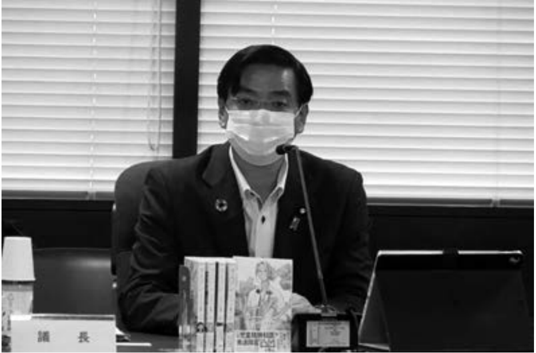
ヤングケアラー支援

さんの個人的な体験の実感があって、何とかしなきゃいけないという強い思いでそういう役目が回ってきた、あるいは、そういうお仕事を自ら選んで推進してきたというのは本当に言うはやすく実行するのは難しい中で頑張られたということですよ。