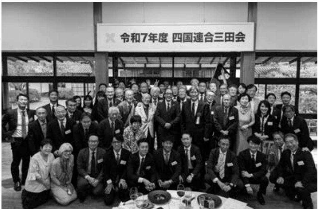
慶應大学 三田会ネットワーク 四国連合三田会 (2025年10月)

慶應大学に入ったということで、初めて深く福沢諭吉先生の事を学びました。また多くの素晴らしい教授陣から様々の事を教えていただきました。また三田祭など大学内のサークル活動も含め