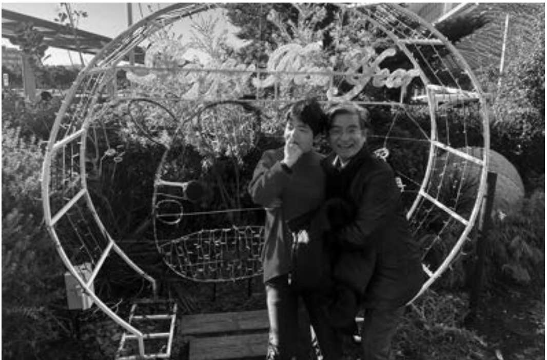
障がいの娘との写真

—— やっぱ、途中で目を離すことができない、応援もなかなか家族以外には得られないという、実情は大変ですよ。そ