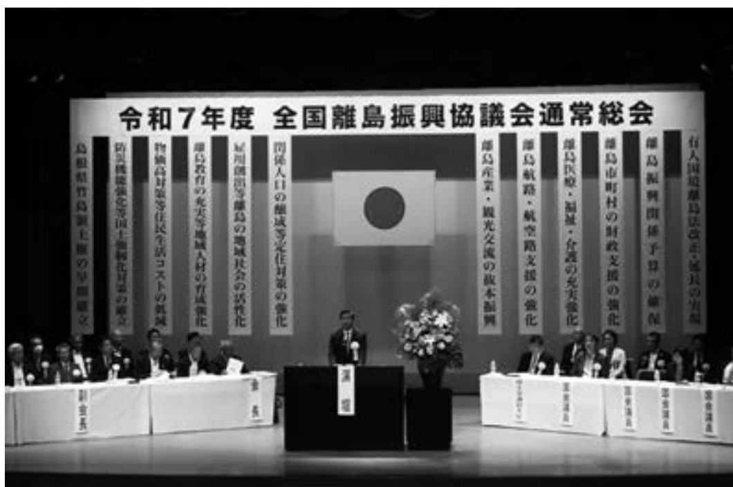
全国離島振興協議会 総会挨拶（隠岐の島）

その中でも特に「有人国境離島」という特に安全保障上大変大事な七十一の島々になりますが、よりもっと多くの支援が必要という事で「有人国境離島振興法」を二〇一六年に作らせていた