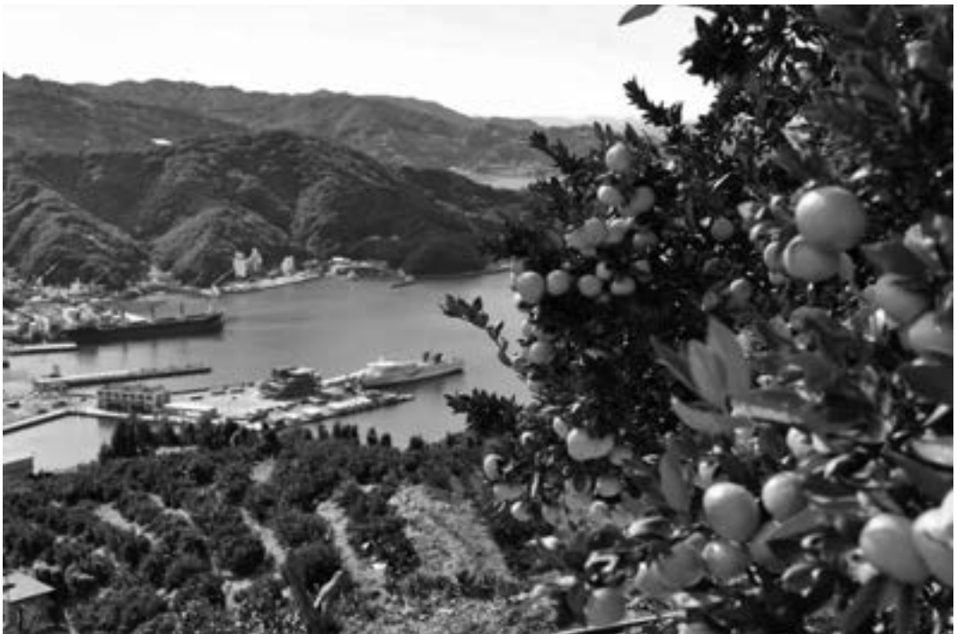
故郷八幡浜市のミカン畑写真

代々私たちは、温州みかんの日本一の産地というふうに言っていますけども、まさしく向灘の「日の丸みかん」や「真穴みか