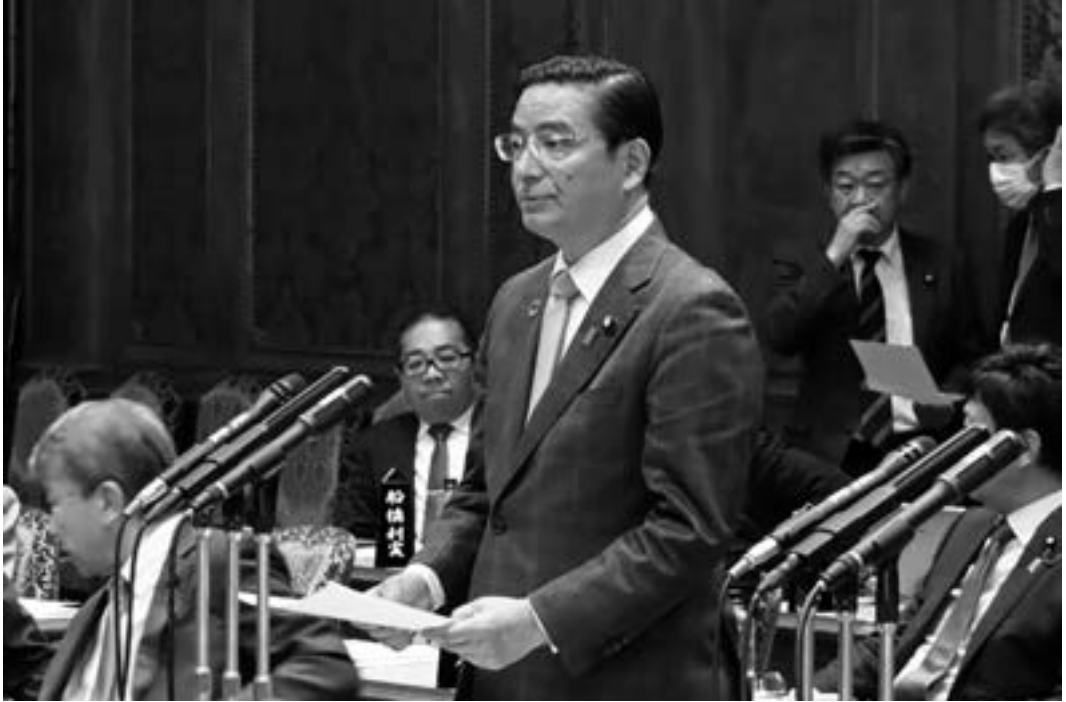
予算委員会 集中審議での質問（2023年3月）

事を回していただくという法律です。この法律成立によって工賃が上がりました。現在全国平均の工賃は月約二万四千円と倍になりました。